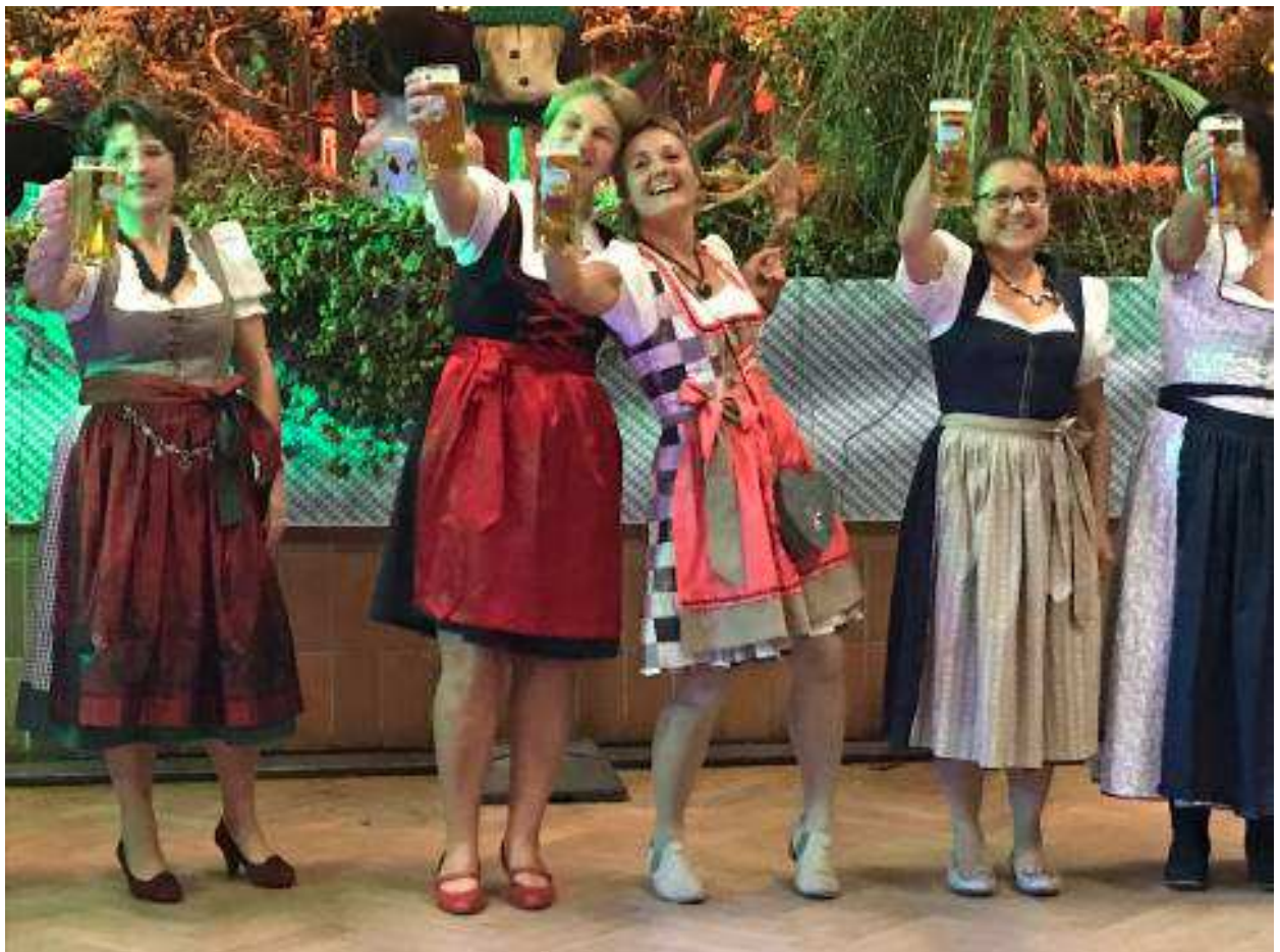
Halbes Mass bei den Frauen – die haben länger als die Männer ausgehalten.....