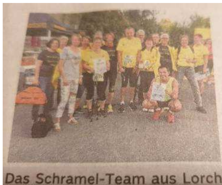
Das Schrammel-Team aus Lorch