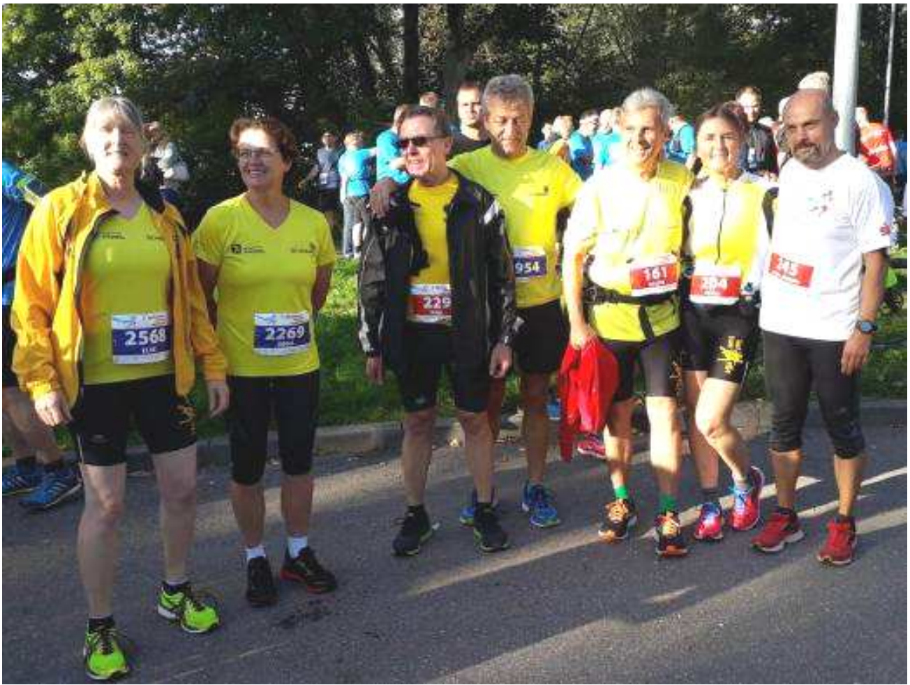
Remstalarmarathon 2019 – vor dem Start.....