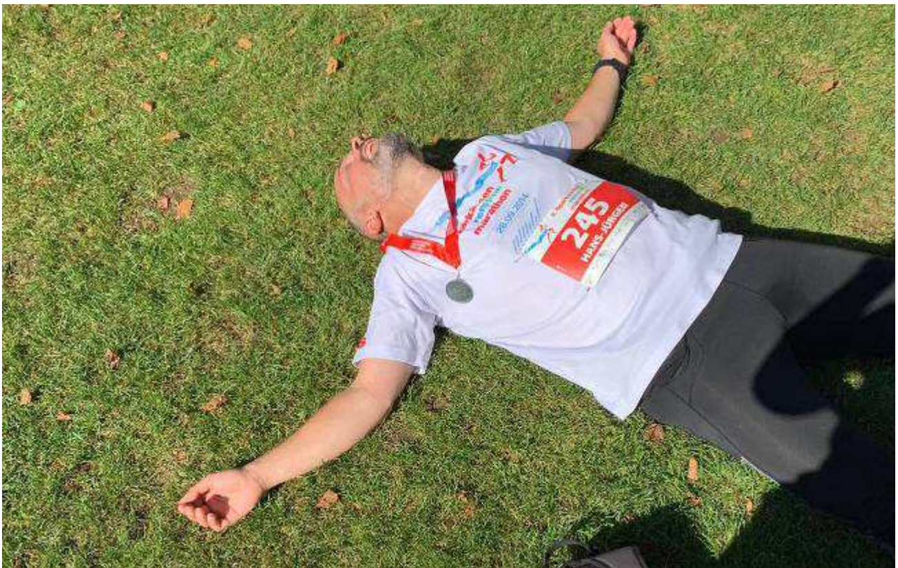
.... nach dem Lauf