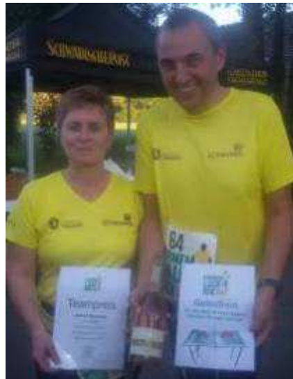
Autohaus Schramel mit größter Gruppe gewannen einen Eintritt ins Fußballstadion nach Aalen sowie eine Flasche Prosecco (alkoholfrei) und eine Mini-Tischtennisplatte.