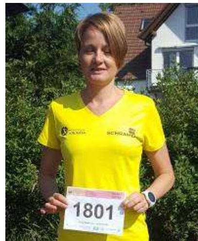
Carola 10 km