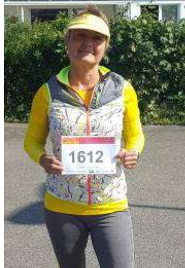
Elke 5 km