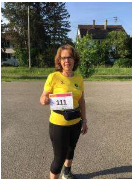
Gabi 5 + 10 km (an versch. Tagen) und 21 km