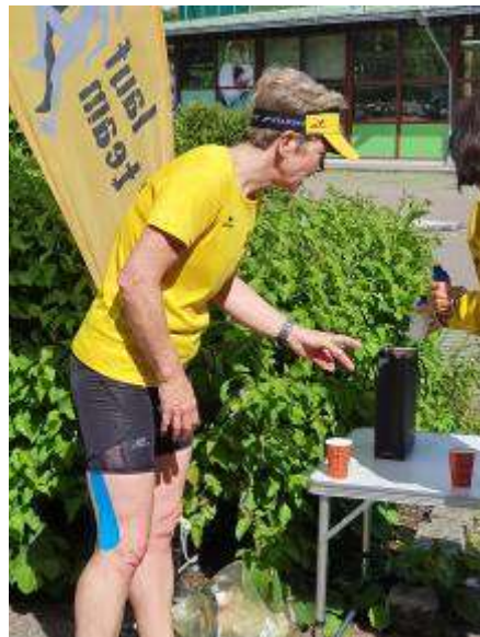
Gabi hatte zu wenig Wasser